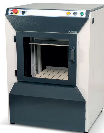
Автоматический вибрационный шейкер – Corob SIMPleshake 30