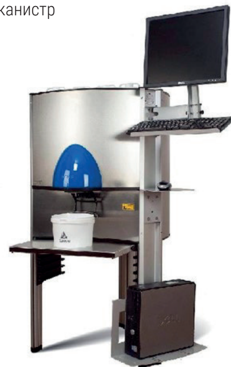
Новый Дозатор D-200