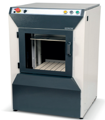
COROB™ SIMPLEshake 30