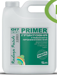
P-017 Грунтовка глубокого проникновения